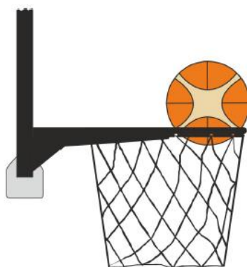
Diagram 4 Lopta je unutar koša

31-24 Tvrdnja: Nedozvoljena igra na loptu je kada obrambeni igrač dira loptu za vrijeme dok je ona u košu.