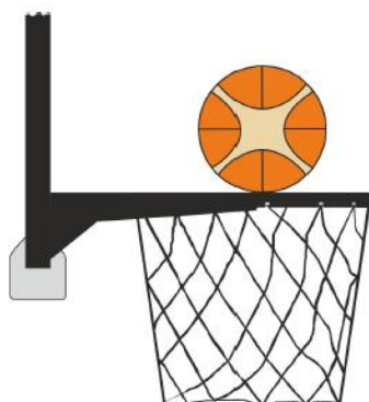
Diagram 3 Lopta u kontaktu s obručem

31-19 Tvrdnja: Nedoželjena igra na loptu je ako obrambeni igrač ili napadač, za vrijeme pokušaja šuta, dira koš (obruč ili mrežicu) ili tablu za vrijeme dok je lopta u dodiru s obručem i još uvijek ima mogućnost ući u koš.