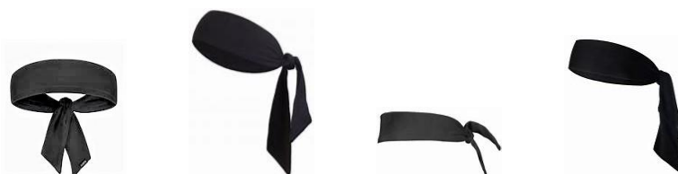
Diagram 1 Primjeri traka u obliku poveza

4-4 Tvrdnja: Nošenje traka u obliku poveza nije dopušteno.